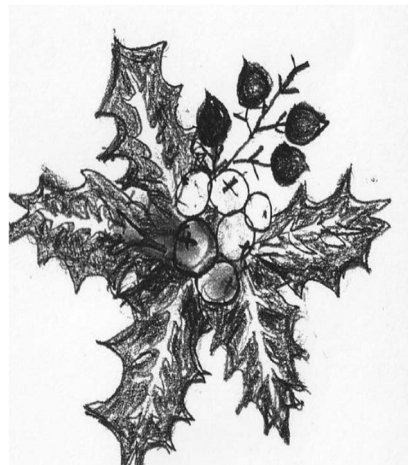
イラスト:川口綾子さん