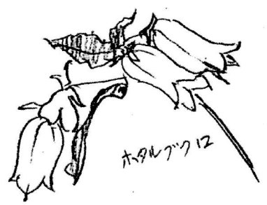
イラスト: 荒川朝美さん