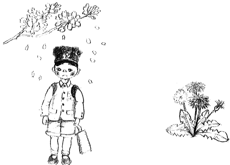
イラスト: 荒川朝美さん